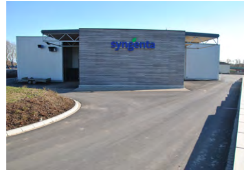
2015 Syngenta Seeds GmbH Bad Salzflen LP 1 - 5 + 8