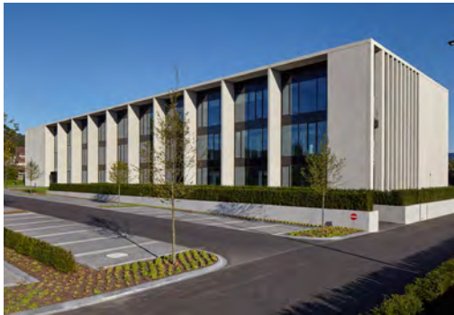
2015 Schulungszentrum Hörmann KG Steinhagen LP 1 - 9