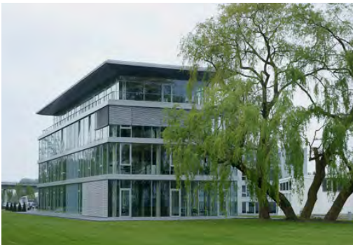
2008 Innovationszentrum I. Lemgo LP 1 - 5