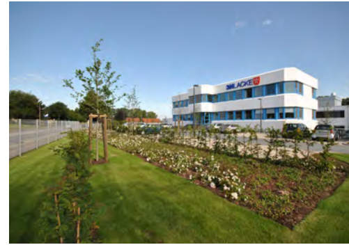
2011 3H-Lacke GmbH Hiddenhausen LP 1 - 9