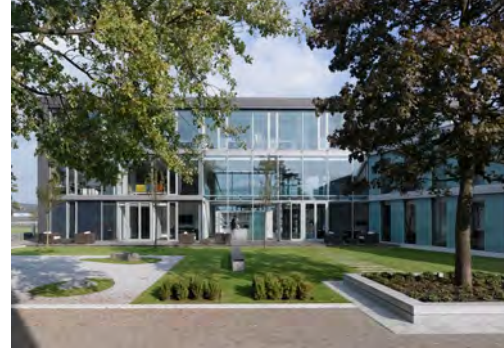
2008 Inometa Technologie GmbH Herford LP 1 - 5