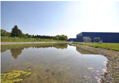
2008 Hörmann KG, Werk Brockhagen Steinhagen-Brockhagen LP 1 - 9