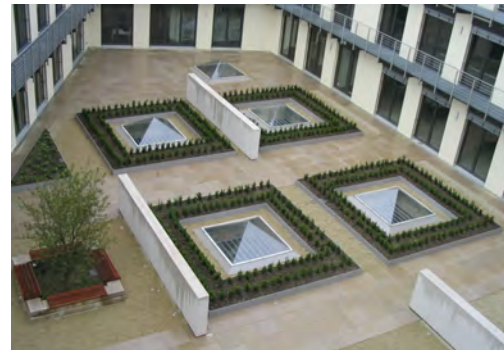
2005 Wellehaus Bielefeld LP 2 - 8