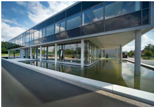
2014 Gebr. Tuxhorn GmbH & Co. KG Bielefeld LP 1 - 9