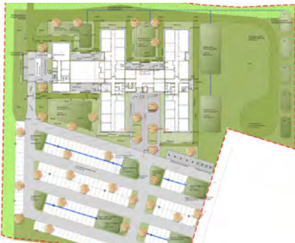
seit 2015 Blue building Löhne LP 1 - 9