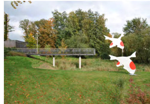
2011 Unternehmenszentrale Hörmann KG Steinhagen-Amshausen LP 1 - 9