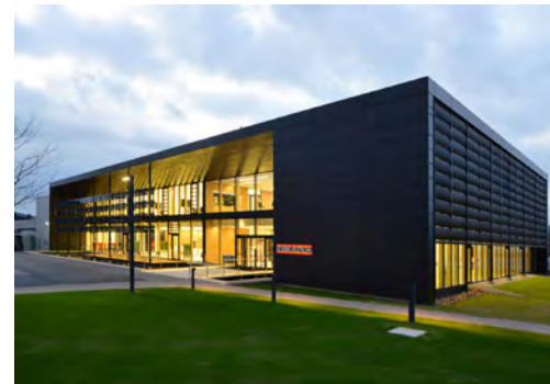
2015 Schulungszentrum Stiebel-Eltron GmbH Holzminden LP 1 - 9