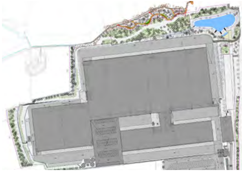
2015 Hermes Logistikzentrum Löhne LP 3 - 6