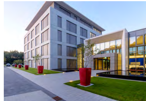
2015 Firmenzentrale Porta Gruppe Porta Westfalica LP 1 - 9