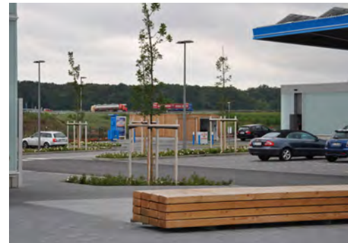
2011 Tank- und Rastanlage AUREA, BAB 2 Rheda-Wiedenbrück LP 1 - 8