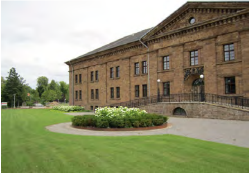
2009 Nachnutzung Klinikum II Minden LP 1 - 9