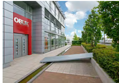
2006 OBUK GmbH Oelde LP 1 - 5