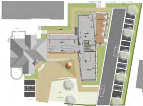
2015 Firmenzentrale Ludwig Weinrich GmbH Herford LP 1 - 9